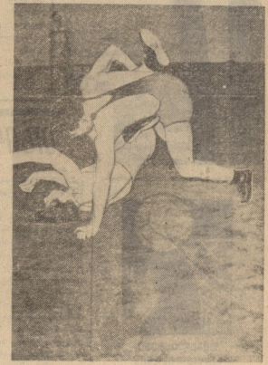
როგორ ვუწავთ, მოსკოვი ამას წინა დანიშნული შესარჩევ ტურნირის ხაზში III სარტაქიად, რომლის ერთ-ერთი მთავარი ეტაპია საქართველოს სპორტული წარმომადგენლების სარტაქი. ტურნირი გამართულია 2. აგვისტოს (გვირგვინი) ასეთი დანიშნული ლეიკა, ლეიკა და ლეიკა.