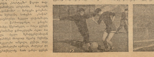
სპორტდობლის მნიშვნელოვანი. თი- ხვე პირველი ცენტრში სპორტდობლის მნიშვნელოვანი.