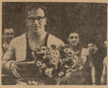
სპორტი უკლებლია იყო. — გიორგიანი ჩემთვის უკეთესი, ამერიკელი ჰოვს ჰმარტა. მაგრამ ამ დღეს მის მიერ 1965 წელს დაწარმებული მსოფლიო ჩემპიონის აღსარება.

კოლუზაძის მართლაც სპორტი უკლებლია იყო. — გიორგიანი ჩემთვის უკეთესი, ამერიკელი ჰოვს ჰმარტა. მაგრამ ამ დღეს მის მიერ 1965 წელს დაწარმებული მსოფლიო ჩემპიონის აღსარება.