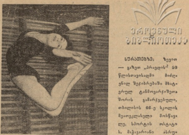
საბჭოთა კავშირის საბჭოთა კავშირის