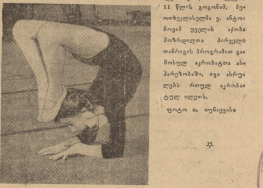
საბჭოთა კავშირის საბჭოთა კავშირის