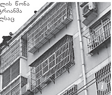
მოამზადა კახა ხატიაშვილმა

ერთ-ერთი სამართალდამცავი სახურავის შერეობაზე გადავიდა და ქმარს ქალის ამოყვანაში დაეხმარა. ამ დროს მის კოლეგებს ქალი უკვე ტანსაცმლით ეჭირათ და ძირს ჩავარდნის საშუალებას არ აძლევდნენ.