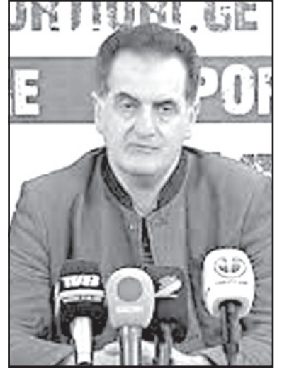
ლი ჩვენგანი გავიღებთ, იქნებოდა ადეკვატურად დახარჯული და არა — გაფლანგული.

სულაც არ ვამბობ, რომ რეფორმა არ არის საჭირო. ამისთვის დიდი ხნის წინ უნდა ეფიქრათ, მაგრამ არავის აწყობდა რეფორმირებული საზოგადოებრივი მაუწყებელი, სადაც ყველაფერი იქნებოდა მაღალი სტანდარტის შესაბამისად, მათ შორის ის დაფინანსებაც, რომელსაც თითოეუ-