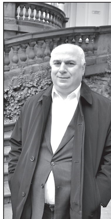
„საკაშვილმა ახალი დირექტივები გასცა“

სფორმაცია, მოდერნიზება, ზოგიერთი გადაცემის შინაარსის შეცვლა. ამისთვის მოსახლეობა ფული როგორც ბიუჯეტიდან, ისე არასახიფტო წყაროებიდან. გადაცემების დახურვა გამოსავალი არ არის. გადაცემების უკან უამრავი ადამიანი დგას, რომლებიც ულუკმაპუროდ დარჩებიან. — როგორ უნდა შეფასდეს ითქვას, რომ საზოგადოებრივი მაუწყებლის საქმიანობა მხოლოდ რეიტინგით არ უნდა შეფასდეს. — დიას, მხოლოდ რეიტინგით არ უნდა შეფასდეს. ან რატომ უნდა იყოს სწორება სხვა ტელევიზიებზე? ეს ტელევიზიები ხშირად აფიშირებას უწევენ ნარკომანიასა და პროსტიტუციას. — აღინშნეთ, რომ ნაციონალურ თანავს არის დაკავშირებული, დაუსჯელია. ეს კობიტაციის ბრალია? — ხელისუფლება ცდილობს, კონსტრუქციული იყოს. ამით სარგებლობს ნაციონალური მოძრაობა და ახალ რევოლუციურ სენარებს დგამს. სააკაშვილსა და მის სატელევიზიო ჰქონდათ პროცესებში სამხედროების ჩართვის სურვილი. ისინი ცდილობენ სოციალური პროტესტის გამოყენებასა და პროვოკაციების მოწყობას. ხელისუფლებამ უნდა იცოდეს, რომ შეიძლება დაინდოს ისეთი პროცესები, რომელთა შეჩერებაც ძნელია. ისტორიის მსგავსი მაგალითები ასობევს. — ხელისუფლება თავისი შეცდომებით არ აძლევს გააქტიურების საბაზს ნაცმოძრაობას? — ეს კალაციას ხელი არ უნდა შეეწყოს. სწორედ ამაზე ვსაუბრობ. საჭიროა სიფრთხილე და გონიერება. სატელევიზიო მხოლოდ სიკვდილზე, აფეთქებაზე, ძარცვასა და ნგრევაზე