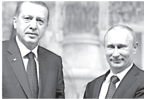
მოამზადა ნიკა თევზაძემ

პუტინი და ერდოღანი შეთანხმდნენ, რომ შეიქმნება ერთობლივი კომისია, რომელიც მომხდარი ტრაგედიის მიზეზებს გამოიძიებს.