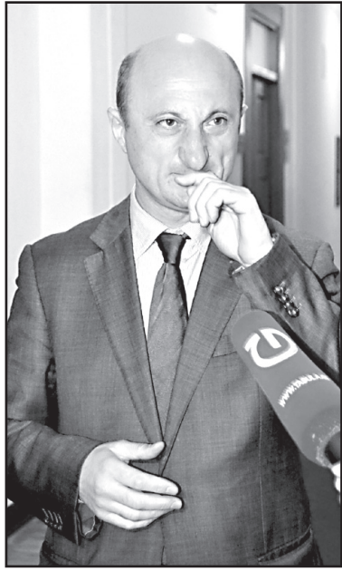
თი აგური რევოლუციის მოსურნეთათვის?

— დღეს ქვეყანაში შექმნილ ვითარებას როგორ აფასებთ? ზოგიერთი დღევანდელი სიტუაციის აფასებას, როგორც რევოლუციისთვის კლასიკურ მოცემულობას. — წინასარევილეიჯი მდგომარეობა არ არის. არც ყველაფერია ძალიან კარგად. ზოგიერთს სურს იმგვარი სურათის დახატვა, რომ ქვეყანაში არის აბოკალიფსური მდგომარეობა. მათ მიმართ სოლიდარული ვერ ვიქენები. — ერთი ნაპერწკალია საჭირო და ერთ დღეში ბარკადები აღიმართება. როგორც ასეთი აზრები ჩნდება, რაღაც წანამდლები არ არის? — დღეს ქვეყანაში დემოკრატიის უმაღლესი ხარისხია. იმ მოცემულობაში, როდესაც არ იდევნება თავისუფალი სიტყვა, ბეჭდვითი მედია და ელექტრონიული მედია (ეს ასეც უნდა იყოს), საზოგადოების გარკვეულ წრეებში არსებობს რევოლუციური განწყობები. ამ ქვეყანაში დავიბადე, გავიზარდე და გავიარე ყველა ის კატეგორია, რომლებიც ქვეყანაში ბოლო 25 წლის განმავლობაში გაიარა. ნამდვილად არ არის წინასარევილეიჯი მდგომარეობა. ჭიქაში ქარიშხლის ატეხვა ნამდვილად უადგილოა დღევანდელი მოცემულობისთვის. — რამდენად გამართლებულად მიგჩნიათ განცხადებები, რომ შეიძლება გააჩერონ საზოგადოებრივი ტელევიზიის ყველა პროგრამა და დაითხოვონ ყურნალისტები? ჩვენ გვახსოვს ტელევიზიის კიბებზე ჩამოსხმარა ყურნალისტები. ეს ხომ არ იქნება ერ-