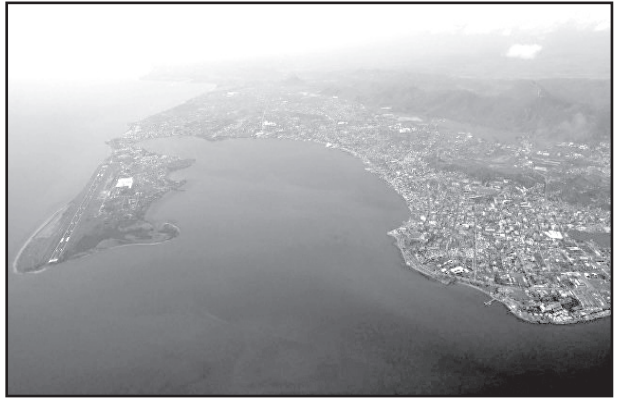
მოამზადა ბუქა გოგინაშვილმა

მიწისძვრის შედეგად რამდენიმე დასახლებულ რეგიონს დიდი ზარალი მიაღწია.