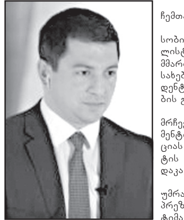
უფრო მაღალი, ვიდრე უმრავლესობის ლიდერი. მე არ ვფიქრობ, რომ პრეზიდენტს უნდა შეხვდეთ და ვესაუბრო ამაზე.

— მე არავინ დამკავშირებია, პრეზიდენტს ჩემთან შეხვედრის თხოვნა არ ჰქონია. ასე უპასუხა საპარლამენტო უმრავლესობის ლიდერმა პატიმარ თალაქვაძემ ჟურნალისტების შეკითხვას, რა მიზეზით თქვა უარი მმართველმა გუნდმა ფარული მოსმენების შესახებ კანონპროექტთან დაკავშირებით პრეზიდენტის ადმინისტრაციასთან კონსულტაციების გამართვაზე. როგორც თალაქვაძემ პრეზიდენტის მრჩევლის, ვიქტორია ჩინჩაძის განცხადებაზე კომენტარებისას აღინშნა, არ ფლობს ინფორმაციას იმის შესახებ, თუ ვინ უთხრა პრეზიდენტის ადმინისტრაციას მოსმენების უპირობო დაკავშირებით კონსულტაციებზე უარი. — არ არსებობს ასეთი ფორმატი, რომ უმრავლესობის წევრი შეხვდეს პრეზიდენტს. პრეზიდენტის ინსტიტუტი არის მაღალი ლეგიტიმაციის მქონე, პრეზიდენტი არის ბევრად უფრო მაღალი, ვიდრე უმრავლესობის ლიდერი. მე არ ვფიქრობ, რომ პრეზიდენტს უნდა შეხვდეთ და ვესაუბრო ამაზე. თქვენგან მოვისმინე, რომ ღამით დაურეკეს ფრაქციებს და ფრაქციებმა უარი უთხრეს პრეზიდენტს. ასეთი კომუნიკაციის ფორმა გაუგებარია ჩემთვის. თუ ამაზე იქნება მეტი კომენტარი გასაკეთებელი, გააკეთებენ ფრაქციების წარმომადგენლები, — განაცხადა პატიმარ თალაქვაძემ.