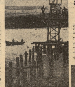
მე გავეცი პარიზში (სურათი მარჯვნივ) მანქანები, რომლებიც დაეხმარებოდნენ ნაგებობის დასრულებას...