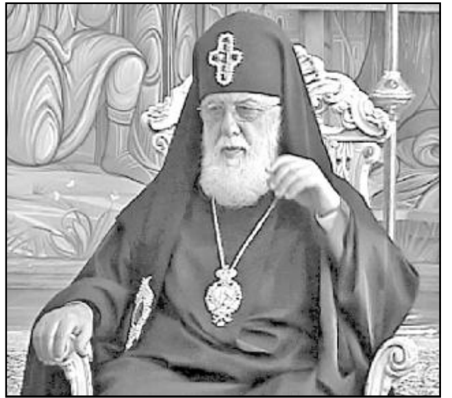
II-ის ავტორიტეტი მტკიცეა და მას ვერც ერთი ქართველი პოლიტიკოსის ავტორიტეტი ვერ შეედრება. შეიძლება ვიღაცას შური და ეჭვიანობა ამოძრავებს. ასეა თუ ისე, ეს ძალიან საგანგაშო ინფორმაციაა და ფიქტიურად, მას პოლიტიკური ხარისხი აქვს“, – განაცხადა ვსევოლოდ ჩაპლინმა რუსეთის საინფორმაციო სააგენტო „Национальная Служба Новостей“-ს კორესპონდენტთან საუბარში.

„ვფიქრობ, რომ აქ ქართველი პოლიტიკოსების რაღაც თამაშებთან გვაქვს საქმე. მათგან ზოგიერთს შესაძლოა, პატრიარქის თავიდან მოშორების სურვილი აქვს. არაა გამორიცხული, რომ ეს ისტორია ეკლესიაზე ზეწოლისათვის გამოიყენება. პატრიარქი ილია I ძალიან პატივცემული ადამიანია, იგი თანამედროვე მსოფლიოში მართლმადიდებლური კონსერვატიზმის ერთ-ერთ სიმბოლოდ ითვლება. ალბათ, ვიღაც ცდილობს, ამგვარად ჩაერიოს ეკლესიის შიდა საქმეებში. ცნობილია, რომ ილია