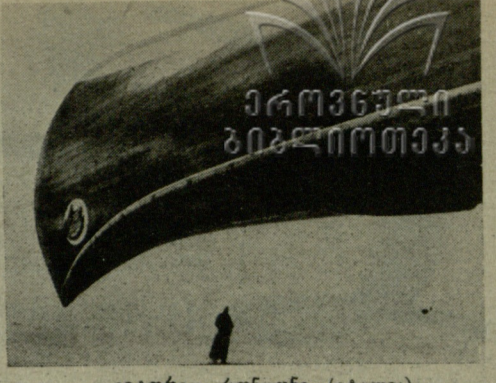
ვიტორიო რონცონი (იტალია). „ნომადის ცხვირი“