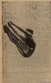
სამართალი სხვადასხვა 111 სკოლის მოსწავლეებისთვის...