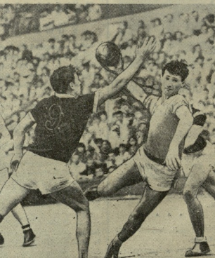
დასაწყისი 20 სათხე

წელს, ნიშნების დღითვე ოლიმპიური ჩემპიონატი, სადაც ვერდი ვიტალიანოს მიხედული მსოფლიო ჩემპიონატის ფინალი (II ადგილი) და ოლიმპიური ჩემპიონატი - იტალიელების ვერდი ვიტალიანოს ეპიპედის მიხედული შეჯიბრებისთვის.