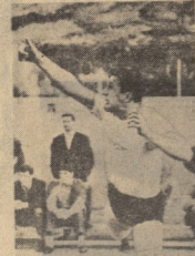
სწავლის ახალისი პირდაპირი მნიშვნელობა ახალი...