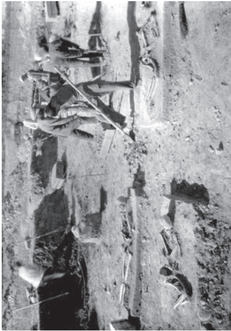
ტყვიავის ყორღან „ხარის გორას“ გათხრის პროცესი, 1938 წ.