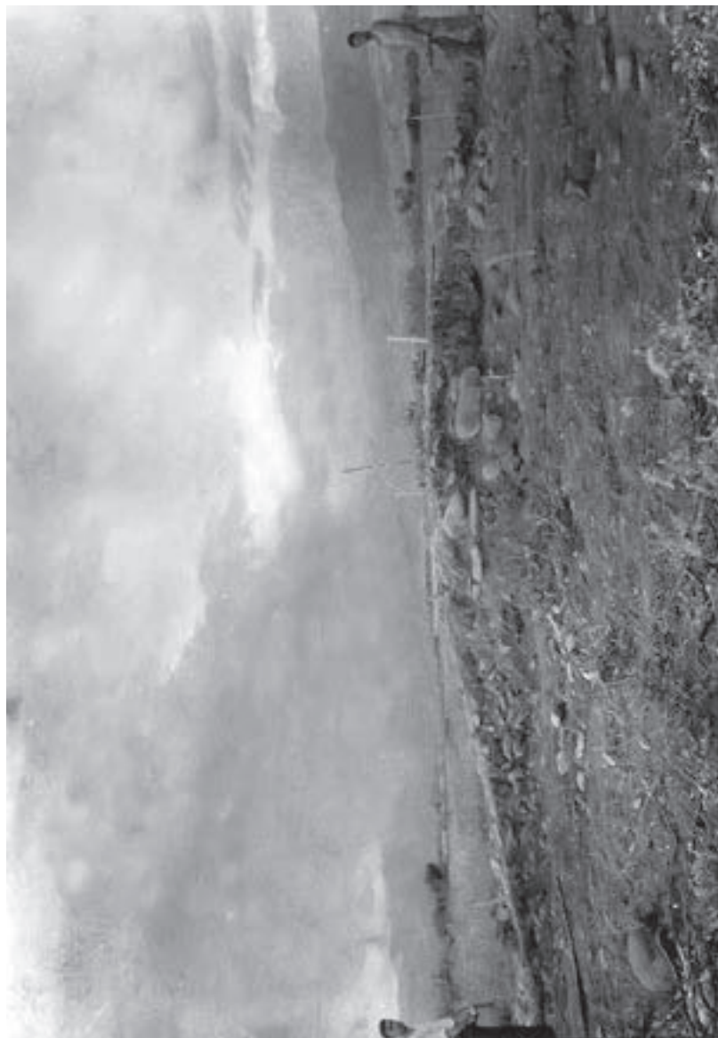
ტყვიავის ყორღან „ხარის გორას“ ჭრილი სამხეთით, 1938 წ.