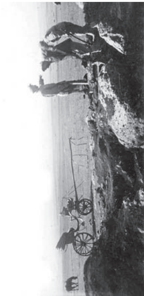
თრიალეთის არქეოლოგიური ექსპედიცია, 1936წ.