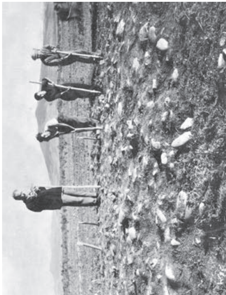
პროფ. სერგი მაკალათია ტყეიანის ყორღან „ხარის გორას“ არქეოლოგიური გათხრების დაწვებისას, 1938 წ.