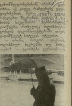
საბრძოლო ოლქების წევრების...