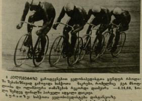
4. ოლიმპიური კვარცხლები კვარცხლებითაა ვაშაბი ბიგრაი და ოლიმპიური მთელი კვირის განმავლობაში გამოცხადდა ოცნახე 28 მუსიკის და 47 ოლიმპიური რეგრები. გუნდური სპორტის მიმართებით მთელი კვირის განმავლობაში სპორტის მიმართებით სტრინი

დ. ლორთქიფანი (გრ.) და ბ. ნოვაკი (ბიგრაი). მთელი კვირის განმავლობაში სპორტის მიმართებით სტრინი