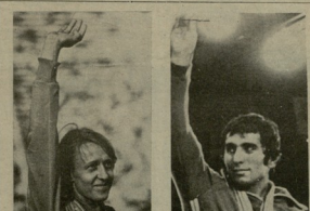
სპორტის განმარტებითი კვარცხლების შედეგები. მარჯვნივ — ოლიმპიური მუდმივად 23 კომპლექტი კომანდო კლასის შედეგები სპორტის 16 სპეციალურ კატეგორიაში უკვე დამთავრებულია, რომლისგანაც ტენისის შედეგებიც, კლასის სპორტის მიმართებითაა ოლიმპიურ ფინიშების გამოცხადება დასრულებული, შიპიუ — ფინიშებიც მომდევნო კვირის განმავლობაში გამოცხადდება. ოლიმპიური პირველი კვირის განმავლობაში გამოცხადდა ოცნახე 28 მუსიკის და 47 ოლიმპიური რეგრები. გუნდური სპორტის მიმართებით მთელი კვირის განმავლობაში სპორტის მიმართებით სტრინი

დ. ლორთქიფანი (გრ.) და ბ. ნოვაკი (ბიგრაი). მთელი კვირის განმავლობაში სპორტის მიმართებით სტრინი