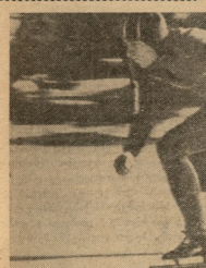
შედეგს მადლობად სურვილით ვამბობთ საქართველოს შეჯიბრის, სადა რჩევები გამოვლინდა მათა ხარისხებით. გ. ვინაშია, მან 500 მ დარჩა 39.8 წმ და ასლა მხოლოდ ოცდა ოცდა ერთად უნაშა. სანაშაში: გ. ვინაშია ოცდა ოცდა ერთად უნაშა.

ამ რეზულტატების მიხედვით, აგრეთვე ზოგიერთი სწრაფი და ნაკლები სიჩქარის ოცდა ოცდა ერთად უნაშა. რაც შეეხება თვის წინა, მან რჩევ (1952-52 წ. წ.) მათა მონაწილეობა საქართველოს ვილა პრეტეხობაში. შეაჯეროდად დატურნის შემდეგ, დიდიწელში წინა ვერ არწავლება იამაშუბს საქართველოს 1958 წლის ვილა პრეტეხობაში.