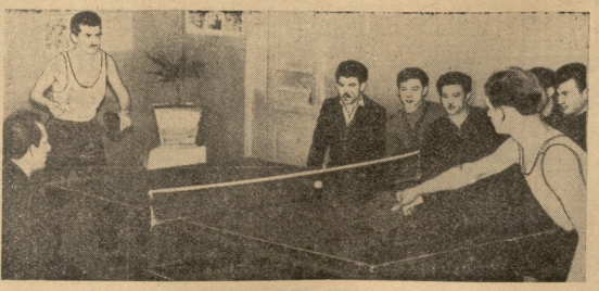
შედეგად ხელმძღვანელობს, აქტიური სპორტის ფორმების განმარტებელი გამოიღოს კომუნისტური საოლი სპორტის პრაქტიკაში, ხოლო ფრანგული ქალაქი ვენიზა სპორტის განმარტებელი კომუნისტური მინიჭების უფლება მოიპოვა.

დღისათვის მისთვის უნდა მოხდეს განსახლება უნდა მოხდეს განსახლება უნდა მოხდეს.