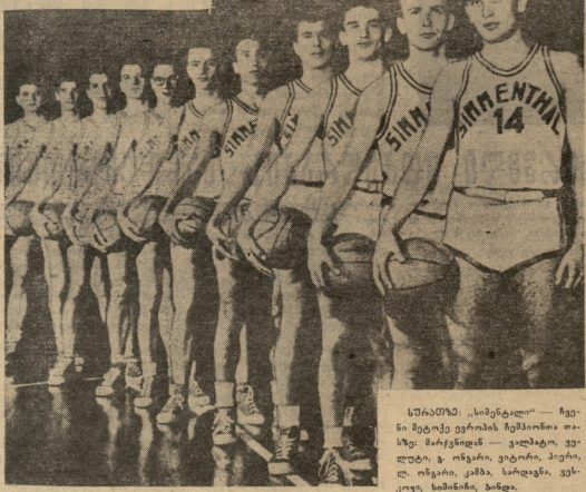
სინცენტრალის „სპორტელ“ — ზედა...