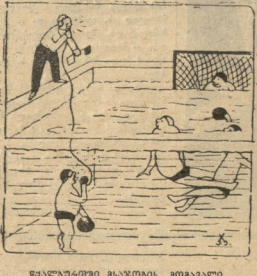
სავაზარდოში მასპრობის მიხედვით... სინცენტრალის „სპორტელ“...