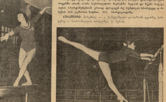
მოყარდა შორის პირად