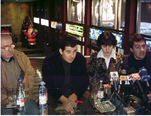
Вчера в здании кинотеатра «Имрали» состоялась пресс-конференция по случаю съёмки фильма о Давиде Агмашенебели.

Недавно во многих средствах массовой информации прозвучало сообщение, что киностудия «Гезиан» намерена снять художественный фильм о великом грузинском царе. Это вызвало определенный ажиотаж в обществе.