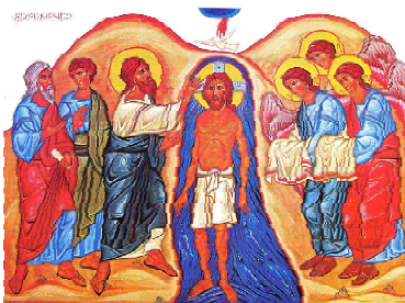
Читайте на 3-й стр.