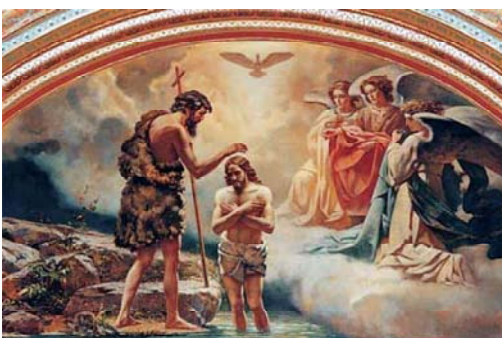
Его. По церковному преданию, Иоанн крестил в Иордане и не имевший грехов, вышел из воды тотчас, как сказано в Евангелии. И когда вышел он из воды, увидел Иоанн разверзающиеся небеса и Духа

было принято в навечерие Богоявления и в самый день праздника крестить огненных (тех, кто, готовясь к приятию крещения, слушал молитвы, наставления - оглашался словом истины). Освященная вода по-гречески называется агисаси, то есть великой святыней. Также ее освящают вои, как и в сочельник - по великому чину, - бабанет и после литургии в день праздника Богоявления. Вода эта имеет большую силу, немелю освященная на молебне по чину великого освящения воды. Ее приятно вкушать натощак, кроме особых случаев - болен и т.п. Праздник Богоявления Господня празднуется в память Божественного Крещения на Иордане от Иоанна Крестителя Господя Бога и Спася нашего Иисуса Христа. Когда исполнилось Иисусу тридцать лет, Он пришел из Галилеи на Иордан к Иоанну креститься от него. Иоанн же удерживал Его: «Ме надобно креститься от Тебя, и Ты ли приходишь ко мне». Но Иисус сказал ему в ответ: «Оставь теперь, ибо так надлежит нам исполнить всякую правду». Тогда Иоанн допускал