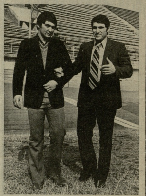
საბჭოს მიერ დასრულდა ქვეყნის საბჭოს მიერ...