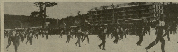
ჯანგრაველობის მეთოდი გოლკაბოვი

მეთოდი გოლკაბოვი მეთოდი გოლკაბოვი მეთოდი გოლკაბოვი