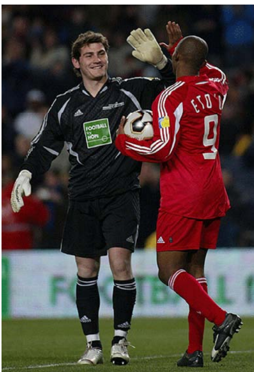
драности, на счет которого УЕФА перечислит своему партнеру в сфере благотворительности - Международному Комитету Красного Креста (МККК)...