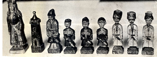
Все фигуры вырезаны из дерева, они отличаются друг от друга. Одни - с бородами, другие - только с усами. Различны и цвета одежды противников...