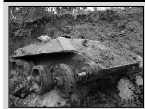
ისრაელში სამხრეთ-დასავლეთის რაიონის ადგილობრივი მთავრობის საბჭოთა ტანკი ტ-34

ქალაქ პოლონში მუშებმა, რომლებიც სახლის საფუძველს თხრიდნენ, მიწის ქვეშ აღმოაჩინეს დიდი ლითონის ობიექტი. საგანი გამოიკვლიეს მონვეულმა ექსპერტებმა და პოლიციელებმა. აღმოჩნდა, რომ მიწის ქვეშ დამალული იყო საბჭოთა ტანკი ტ-34 კოშკურისა და მულღუსოების გარეშე. როდის მოხვდა ტანკი პოლონში, ჯერჯერობით უცნობია.