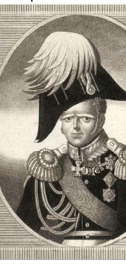
Великий князь Константин Павлович

Был и еще один фактор, который все время заставлял слабовольную Екатерину обращать свой пик Дунаю и Балканам. На него указывают современные свидетельства исследователей и современников. Фельдмаршал Миних, будучи уже в преклонных годах, утверждал, что «Петр Великий в 1693 году (когда он осаждал Козов) до самой кончины своей не выпускал из виду побликого своего намерения завоевать Константинополь, выгнать турок и татар из Европы и восстановить греческую монархию». А. Вейдемейер, автор двухтомного исследования «Двор и замечательные люди в России во второй половине XVIII столетия», указывал, что Екатерина «обрадела свои виды на Турцию, желая возвести на престол константинопольского императора».