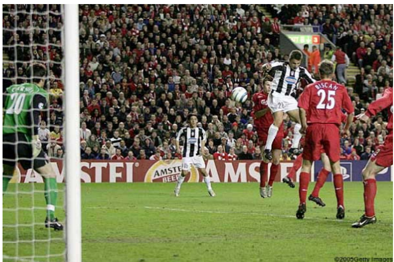
Ливерпуль - Ювентус - 2:1 (2:0)

В первом четвертьфинальном матче Лиги чемпионов на грани фиаско находился один из главных фаворитов турнира итальянский «Ювентус». Команда Фабио Капелло в первом тайме пропустила от «Ливерпуля» два безвредных гола и вполне могла уйти на перерыв проигрывая с более крупным счетом. Сначала после розыгрыша углового отличился финский защитник Сами Хююпя, а затем великолепно дальним ударом испанец Луис Гарсия застал врасплох одного из лучших вратарей мирового футбола Джанлуиджи Буффона. Но во втором тайме игра туринского клуба преобразилась, в то время как «Ливерпуль» стал играть на удержание счета. В итоге на 63-й минуте защитник Фабио Каннаваро ударом головой замкнул передачу Джанлуки Дзамбротты.