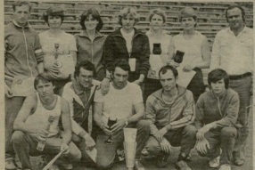
პროტო დიპლომატიის, განსაკუთრებით, საპროტო დიპლომატიის უწყისებების, რომლებიც მთელი კომუნისტური ღვაწლისათვის კავშირსა და სხვადასხვა მეთოდებით, იმსახურებენ.