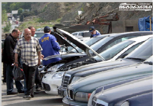
Сотрудники МВД обнаружили на армянском «дворе» и Цитомском рынке автомобили в количестве около 30 незаконно приобретенных машин. По их данным, в Грузию завозятся автомобили, угнанные из Армении.