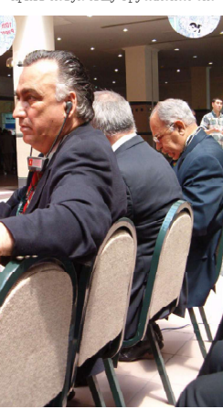
номики и делает первые успешные шаги в реальном секторе, что заслуживает самой высокой оценки.

Издательские гиганты, существовавшие в советский период, уступили сегодня место небольшим полиграфическим предприятиям, гибко откликающимся на запросы рынка. На них и рассчитано полиграфическое