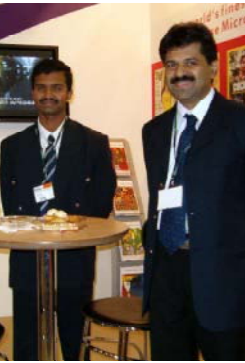
Центру выставок и конгрессов Турции «TUVAŞ» шель 26-й год. Восточнее в одном из окрестных новых районов Стамбула, он стал средоточием деловой активности, кото-

рой небольшой перечень продукции, представленной на выставке ведущими фирмами Турции, США, Великобритании, Германии, Израиля, Китая, Польши и других стран.