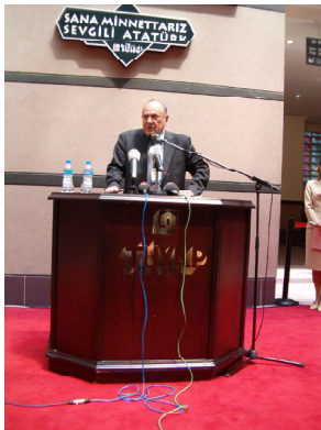
Выставка была организована центром выставок и конгрессов Турции «TUVAŞ»...

Международная 10-я выставка полиграфической и печатной индустрии была проведена в Стамбуле с 17 по 20 мая