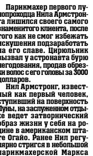
Парикмахер первого лунногохода Нила Армстронга лишился своего самого знаменитого клиента, после того как не смог избежать искушения подзаработать на его славе.