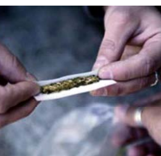
какие разрешают американцам употребление каннабиса в лечебных целях, не защищают их от наказания в соответствии с федеральным законодательством.

Американские власти решили еще больше усложнить и без того нелегкую жизнь наркоторворцев. Из числа их клиентов могут пропасть «легализованные» потребители марихуаны – жители штата Орегон, США, которым было разрешено использовать «травку» в медицинских целях. Теперь их поставили в один ряд с остальными жителями страны, и за незаконное использование этого природного наркотика они, как и все прочие, имеют шанс отойти в тюрьму. Накануне Верховный суд США пришел к выводу, что местные законы 11 штатов,