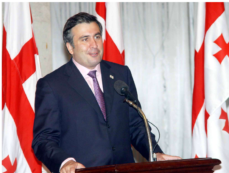
Десятого июля в Батуми, на открытии международной конференции по мирному урегулированию грузино-осетинского конфликта, президент Грузии Михаил Саакашвили еще раз озвучил идею о статусе официального Тбилиси, который предлагает Цхинвальскому региону независимости.

В организованной правительством Грузии двухдневной конференции наряду с официальными представителями властей Грузии участвовали представители международных организаций, местных и иностранных эксперты. К сожалению, фактические власти региона объявили конференции бойкот, назвав ее пир-акцией. Несмотря на мое огромное уважение к вам, я был бы больше рад поговорить с представителями населения Южной Осетии, а не с иностранными представителями и послами. Встреча с вами не была мною приоритетом, - прямо заявил Саакашвили. По его словам, правительство Грузии не намерено мириться с нынешним статусом и обязательно попытается восстановить территориальную целостность страны. «Абхазы и осетины должны понимать, что Грузия с нарушением своей территориальной целостности не смирилась», - подчеркнул он. Как сказал президент, власти Грузии изменили свои подходы к конфликту: - Например, раньше применение термина «Южная Осетия» было равносильно политическому самоуправлению. Многие грузины, в том числе и политики, упоминают Цхинвальский регион или Самачабло, тогда не