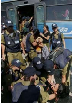
как «плана размежевания» с палестинцами, полностью отсутствуют четыре.

Из 21 населенного пункта сектора Газа, подлежащего эвакуации в рамках «плана размежевания» с палестинцами, полностью отсутствуют четыре.