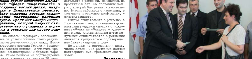
«Проблема, связанные с выдачей свидетельств о рождении, накопились на протяжении лет. Мы поставили вопрос, которые бы решен положительным образом в населенном пункте и регионов конфликта», – отметил министр.