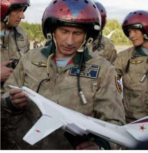
Президент России Владимир Путин не передавал премьер-министру «ядерную кнопку», когда летел на стратегическом бомбардировщике Ту-160 на учения на Северный флот, сообщает BBC.

Выступив несколько лет аналогичный полет на истребителе совершил американский президент Джордж Буш. И его поступок многие также посчитали попыткой проявить на свою сторону голоса избирателей в США. Еще после полета Путина в 2000 году в адрес президента стала разливаться критика по поводу того, что глава государства не имеет права таким образом рисковать своей жизнью.