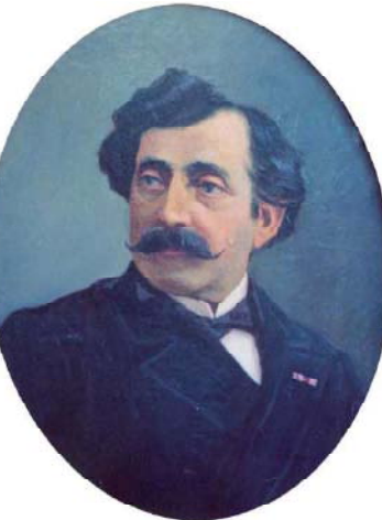
Портрет одного из братьев Зубаловских работы Николая Склифасовского