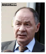
В ходе визита он ознакомился с ситуацией в зоне грузино-осетинского конфликта, о сложившейся в последние дни. Он также должен был содействовать с осетинской стороны дате проведения очередной заседания Смешанной контрольной комиссии по урегулированию конфликта.

Посол по особым поручениям МИД РФ Валерий Кенякин вчера посетил Цхинвали. В ходе визита он ознакомился с ситуацией в зоне грузино-осетинского конфликта, о сложившейся в последние дни. Он также должен был содействовать с осетинской стороны дате проведения очередной заседания Смешанной контрольной комиссии по урегулированию конфликта.