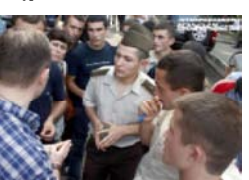
Курсанты Национальной военной академии имени Давида Агмашенебели и их родители вчера попылись вернуться в здание парламента.

«Несколько дней курсанты Национальной военной академии проводят акцию у здания парламента. Они требуют упразднения указа за министра обороны Ираклия Окруашвили и восстановления статуса студентов. Из академии были отчислены