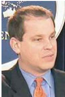
Государственный департамент США распространил заявление, в котором осудил факт артиллерийского обстрела Цхинвали.

США призывает правительство Грузии «предпринять немедленные шаги, чтобы продемонстрировать свою приверженность мирному решению конфликта в Южной Осетии». Госдепартамент США считает, что акты насилия против невинных гражданских лиц не имеют оправдания. Государственный департамент США потребовал от Грузии поставить вопрос об ответственности лиц, которые стоят за данным актом насилия против мирного населения. «Правительство США поддерживает территориальную целостность Грузии и призывает стороны работать в