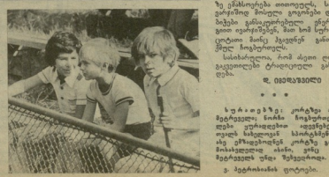
საქართველოს კომპარტი... 1982 წ. ოქტომბერი, 18 თბილისი.