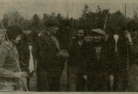
ՄԱՅՅՈՒՄ ԿՐԱՆՆԱԿՆԵՐԻ ՐԱԿՈՆԻ