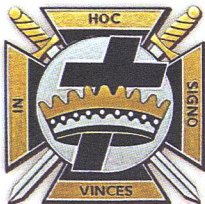
ტაძრელთა იორკული ხარისხის სიმბოლო

ტაძრელთა, ტაძრის რაინდთა ორდენი, 1118 წელს წარმოიშვა, როდესაც ფრანგი დიდებულები ჰიუგო დე პეინმა და კიდევ 8 რაინდმა დადო ფიცი და გაემგზავრა წმინდა მიწაზე, რათა დაეცვათ იერუსალიმში მიმავალი ქრისტიანი პილიგრიმები. ისინი ხდებიან პირველი მეო-