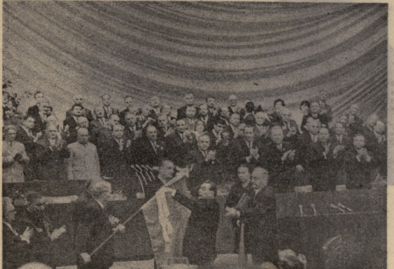
ოქტომბრის 1971 წლის 14 ნაკის ჩარველის საბავთვლო სკოლის სოციალური კავთვლო სკოლის და მშენებლის ბავთვლო სკოლის ორდანი რედაქციის დაჯილდოვების შესახებ

საქართველოს სსრ მშენებელი დიდი დასახლებების ბავთვლო სკოლის, დიდი ექვსობის სოციალური კავთვლო სკოლის და მშენებლის ბავთვლო სკოლის დაჯილდოვების შესახებ სსრ კავშირის უმაღლესი საბიუროს პრეზიდიუმის დაჯილდოვების შესახებ