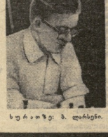
სე რ ა ზ ე ნ კ ი ლ აზ ე ბ ნ ი კ ი