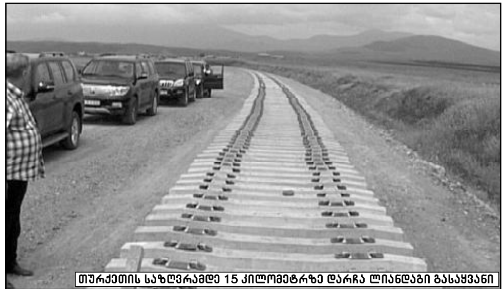
თურქეთის საზღვრამდე 15 კილომეტრზე დარჩა ლინდაში გასაყვანი

ახალქალაქიდან ჩვენი მარშრუტი უკვე კარნახისკენ მიემართება.