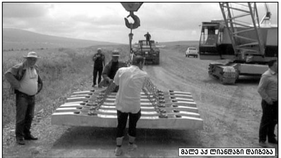
მალე აქ ლინდაში დაიგება

ეს რაც შეეხება მთლიანად სადგურს, მისი ვაგზის მშენებლობა კი დასასრულს უახლოვდება და წლის ბოლოსთვის ყოველმხრივ დამთავრდება. ამავე დროისთვის გვექნება მზად სადგურის ტერიტორიაზე ასაშენებელი ობიექტების 70-80 პროცენტიც. ისიც უნდა ითქვას, რომ ეს ვაგზალი საერთაშორისო დანიშნულებებისა და ექნება ამგვარი ობიექტებისთვის აუცილებელი ყველა სამსახური თუ ინფრასტრუქტურა... (სხვათა შორის, აქსამგვარო შემადგენლობებს შეუქმნებლად შექმნებათ, სპეციალური მოწყობილობის – კამბი-