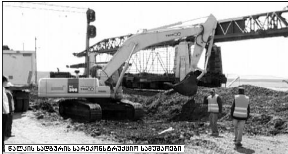
წალკის სადგურის სარემონტო სამუშაოები

ჰოდა, ახლა ვკითხები მას, თოვლში სამშენებლო სამუშაოების, თანაც რკინა-