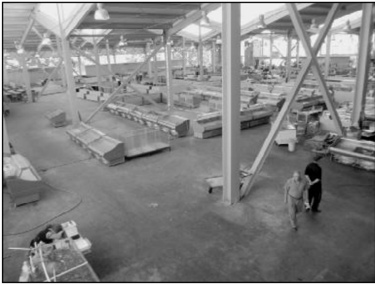
თავისი საქონლის გვერდით ათევს. ალსანიშნავია, ისიც, რომ ბაზარში შესული მოვაჭრეებიც კი ხშირად ისევე იქცევიან, როგორც წლების მანძილზე „გარემოვაჭრეობის ხანაში“ მიეჩვენებოდა: იქაც კი საქონელს დახლებზე კი არა, პირდაპირ... იატაკზე აწყობენ, თუმცა, სავაჭრო გადასახდელს მაინც უხდიან ადმინისტრაციას (??). ამის თაობაზე დირექციაში აცხადებენ – ვერაფერს ვუხერხებთო, თუმცა კი, ეს გასაძირთლებელ არგუმენტად ნამდვილად არ გაამოდგება – რას ნიშნავს, ვერაფერს უხერხებენ? არანაირად არა ვართ დრაკონული წესების მოხრე, მაგრამ მტკიცედ მსამს, რომ სანიტარული ნორმების დაცვა, ვაჭრობის ნორმალური პირობების შექმნა როგორც გამყიდველისთვის, ისე მყიდველისთვის ბაზრის ადმინისტრაციის უწინარესი ამოცანაა.

რაც უფრო მეტად მივუახლოვდი ბაზრის ტერიტორიას, გარემოვაჭრეთა რიცხვებში იმატა და სიბინძურეც მაც. სხვა საქმეზე კი მივდიოდი, მაგრამ უურნალობის ტონი ცნობის მოყვარობამ დაძლია და ბაზრის დირექციას მივამოხურე. თუ „დეზერტირის“ ეზოში თითქმის ყველა დაკავებული იყო და სასოფლო-სამეურნეო პროდუქციით დატვირთული, მანქანებიდან საბითუმო ვაჭრობაც იყო გაჩაღებული, მეორე სართული, სადაც ხორცი, ყველი და თევზი იყიდება და სათანადო მაცივრებიანი დახლებითაა განწყობილი, ფაქტობრივად, სიცარიელე იყო. აქ მოვაჭრეებს მყიდველი თითქმის რომ არ ჰყავდათ, ეს კიდევ უფრო თვალსაზრისით მესაჩუქრებდა. სადაც ბაზრის დირექციის წარმომადგენლებს გავსაუბრე. პირველი, რითაც დავიწყებდი, ბაზარში მოვაჭრეთათვის დადგენი-