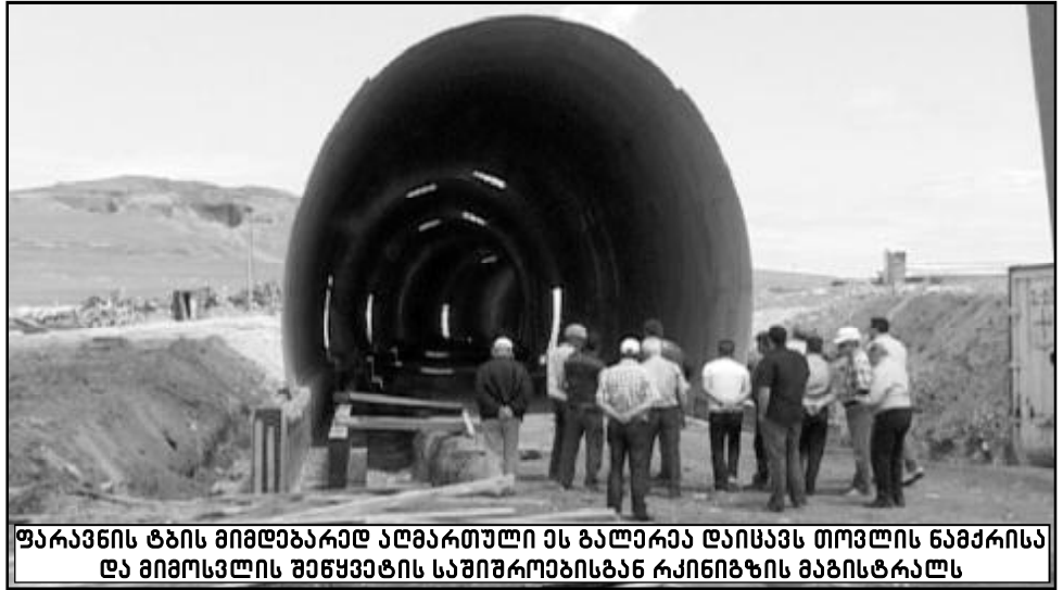
ყარსის ტბის მიმდებარე ადგილას მდებარე ტბის ნაპირისა და მიმოსვლის შეწყვეტის საშუალებების რკინიგზის მანქანის ტრასა