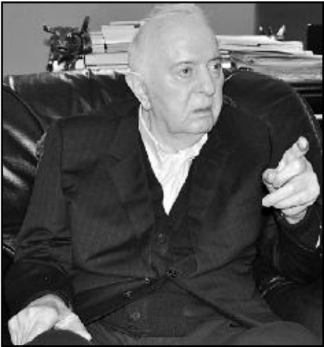
საბარტომეოლს პრემიერ-მინისტრმა ბიძინა ივანიშვილმა ოთხშაბათს ჟურნალისტებთან შეხვედრაზე დაადასტურა განზრახვა, დატოვოს ქვეყნის სახელი-

სუფლს სტრუქტურები. მაგრამ, ამას წინათ საზღვარგარეთის მასობრივი ინფორმაციის საშუალებებისათვის მიცემული ინტერვიუებისაგან განსხვავებით, რომლებშიც განაცხადა, რომ გადადგება პრეზიდენტის არჩევნების შემდეგ, საქართველოს მთავრობის ხელმძღვანელმა არ დაადასტურა, თუ კერძოდ, როდის გააკეთებს ამას.