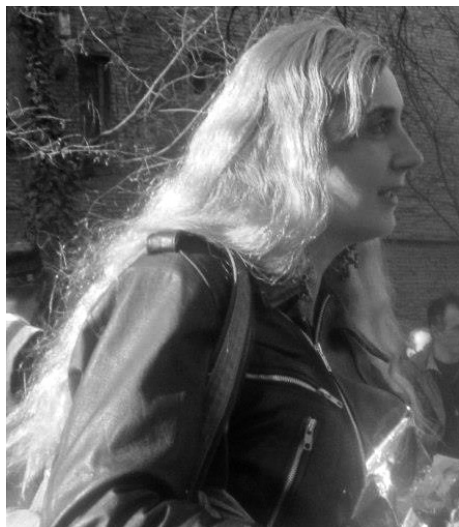
„ბილწო არ შევეკვრი ზავითა!“ ვაჟა

ბიბლიოთეკის გაყინულ დარბაზში დრო-ჟამისაგან შეღავათი გაზეთის ფურცლებსაც შავი დღე ადგათ, შემცივებულ თითებში უგემურად შრიალებდნენ, ასურდული ტექსტების გაცოცხლებას უტყვი სიკერპით ეწინააღმდეგებოდნენ. ინდუსტრიული აღტინებით შედღაბებულ პროპაგანდისტულ ბოღვას ვერაფრით შეთვისებოდნენ, არ სურდათ მაკულატურის ბედი გაეზიარებინათ, მაგრამ ბოლშევიკური იდეოლოგიის მჭახე ლოზუნგი მდინარეების კალაპოტის შეცვლას წინასწარმეტყველებდა და აზროვნების გარდაქმნას (უფრო სწორად, დანაგვიანებას) წინ ვინ აღუდგებოდა?! სატანური ქაღილით შეგულიანებულთაგან ვინ მთვარეს უდერებდა მუშტს, დროა ცის კაბადონი ძღვეამოსილ ნამგალსა და უროს დაუთმო, სანამ მშრომელი ამხანაგი ცარგვალადან კინწისკვრით გადმოგვაგდებსო, ვინ შლეგური „შთავიანებით“ გაბრუნებული თავმოშენებდა, რომ რევოლუციის გასამარჯვებლად დედ-მამასაც სასიკვდილოდ გაიმეტებდა, მავანი ტამარისა და ხატებს შეურაცხყოფდა. გაზეთებში უღმერთობის ნიადაგი ჩაგუბებულყოფი და შეხებისთანავე ბოლშევიკური ობის სიმძაფრე გაუთბობელი შენობის სიპირქეშეში უბოდიშო მხურვალებით იჭრებოდა.