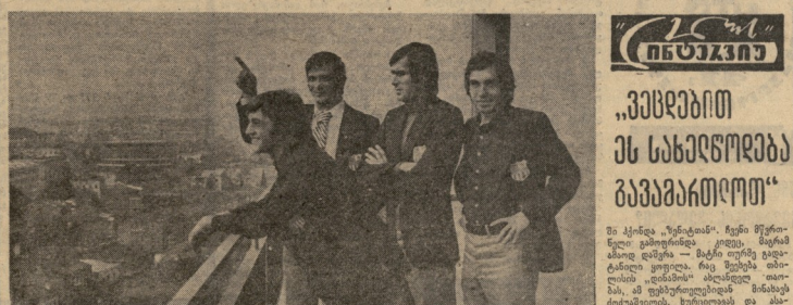
სპორტული კომპლექსი ლელო. ორგანიზაციის წევრები.