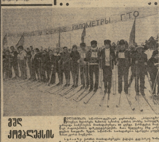
საქართველოს ... მათი უფრო ...