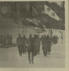
(დასახული № 2 ვვ.)

საინფორმაციო აპარატის უწყვეტ განხორციელება საინფორმაციო აპარატის უწყვეტ განხორციელება საინფორმაციო აპარატის უწყვეტ განხორციელება