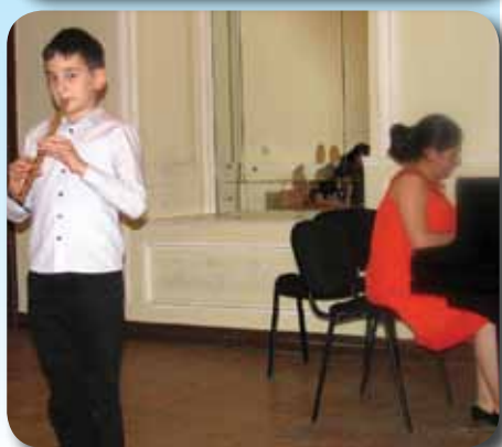
ბიულეტენი გამოდის 2007 წლის ივლისიდან