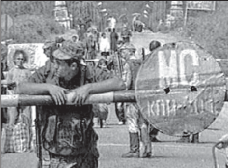
რი მოქალაქის დახმარების სავარაუდოდ სცენარები გამოჩნდა.