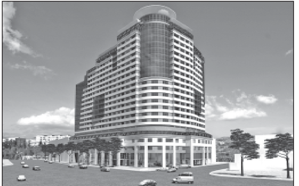
მის: კანდელაკის ქ.№1. ტელ: 38-14-12. 899 62-32-32. 877 76-62-62