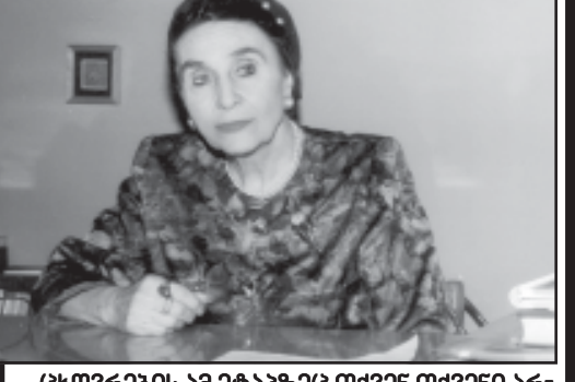
ცხოვრების ამ ეტაპზეც თქვენ თქვენი არჩევანი გააკეთეთ...

თქვენ იხავით ყველასათვის სიმბოლო, ადამიანური სიკეთის, ერთგულებისა და სიყვარულის, უზარალო გემოვნების სიმბოლო, რომელიც თქვენი გუნდობრივი, თანდაყოლილი სიბრძნის სიღრმეებიდან მოდიოდა.