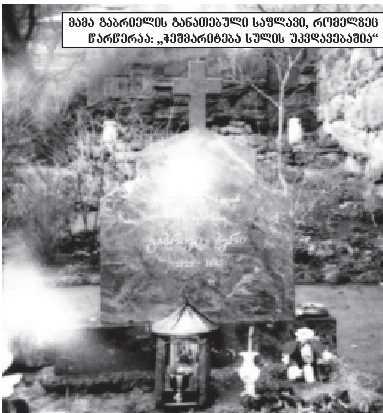
მამა ბაბრიელის განათავსული საფლავი, რომელზეც წარწერაა: „ჩემგარდა სულის უკვლავებაა“