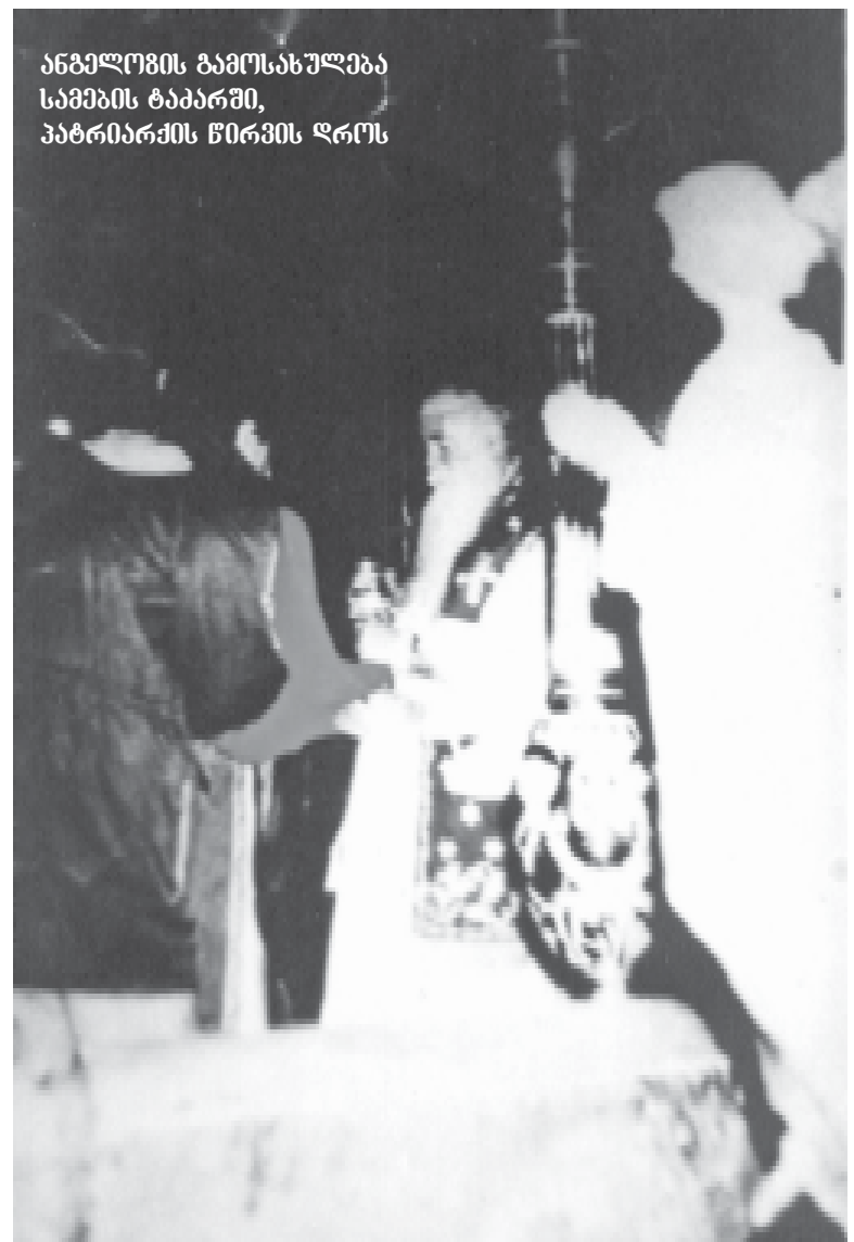
ანგელოზის გამოსახულება სამეფოს ტაძარში, პატრიარქის წირვის დროს

მეცნიერული ექსპერიმენტი ნიშნავს იმას, რომ ერთი და იგივე პირობებში ჩვენ უნდა გავიმეოროთ და დავაკვირდეთ გარკვეულ მოვლენებს. მაგალითად, როგორ მიდის სინათლე, როგორ მოძრაობს მანქანა... ერთი და იგივე პირობებში ანალოგიური შედეგები უნდა მივიღოთ. მეცნიერული ჭეშმარიტება ფუნდამენტური ცდების საფუძველზე ყალიბდება. ცდისეულს ეწინააღმდეგებდნენ მაშინ, როცა რაღაც ვერ არის წესრიგში. მაგრამ ისინი სკეპტიკოსები არიან და არა მარადისობასა და უკვდავებაზე დაფიქრებული მეცნიერები.