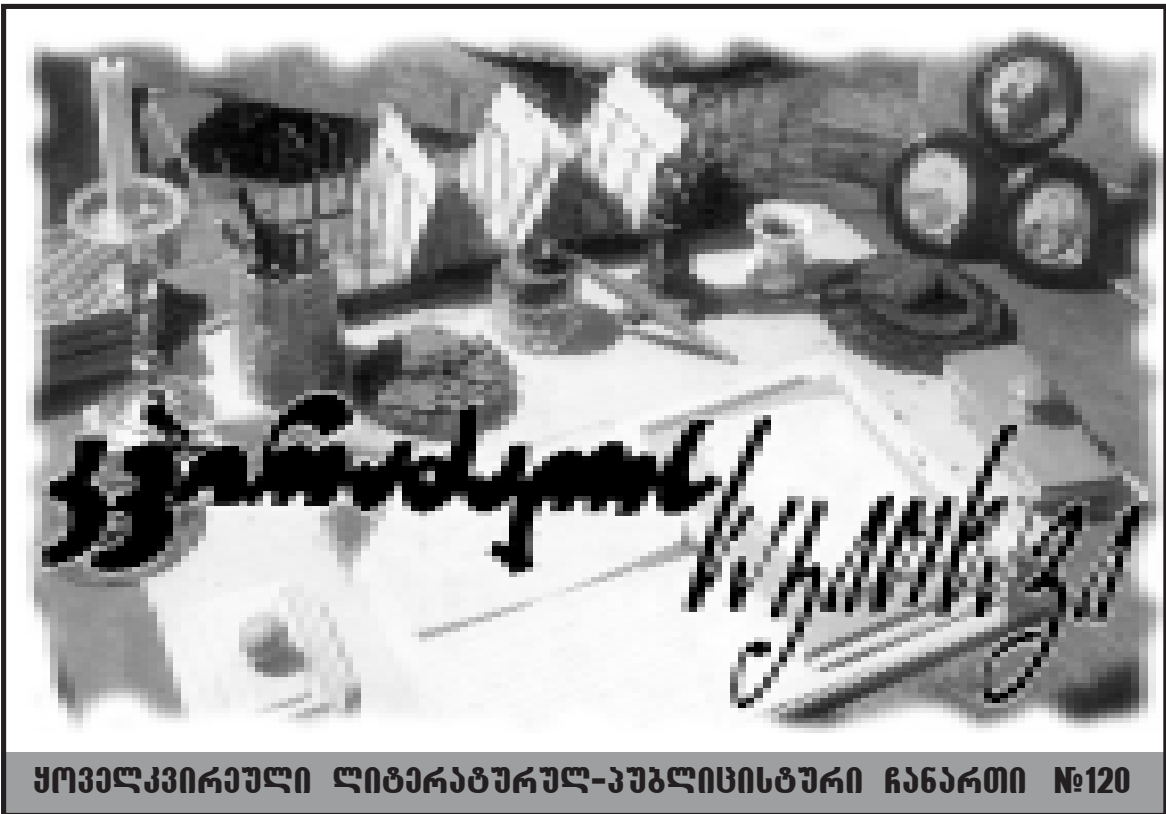
ყოველკვირეული ლიტერატურულ-კულტურული ჩანართი №120

მონსტრულიად იხდიდნენ ანაფორებს და რიგი სასულიერო პირების პოლიტიკურ დაკვეთებსაც ასრულებდა.