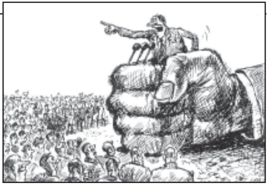
არაფართო გამოიჩინა ოპოზი- ციური პარტიების სუბიექტური პო- ლიტური შეფასებებისა.

ყანაში, რაღვანაც მართლაც კრი- ზისი იყო. ასე, რომ როცა მოხდარ ვაპტაბს უზრუნველი, ის მილიანო- ბაში უნდა განხილულ და გაანალი- ზო და არა ცალკეობდა.