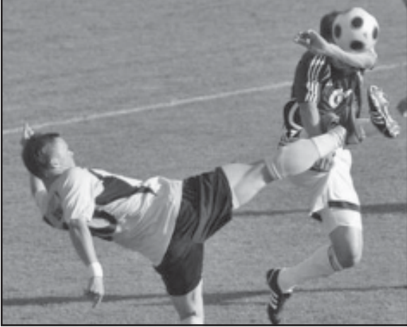
ბამო მინდვირიდან ბააქვეს, უპანსენადი ჟონივრის მცველმა პანსონმა დანიკავა. აი, ასეთ უსუსურ მატჩებთან

ჩვენი თასი „დინამო“- „რუნავიკი“ 3:0. ფარის კუნძულების ჩვენი თეილის 14 ფეხბურთელით ვენია, თანაც, სათადარიგო მკაპრის ბარბა. დავტან-ხმებით, ეს ფაქტის გვინივრად წარმოაჩინა სტუბრთა კალასა და საქმისადი დამოკიდებულებას. მკაპრა შემთხვევით არ გვიხსენებია - გოლო წუთში, რომ წარდილოეთა გოლიკივრი მეორე ყვითელი ბარათის