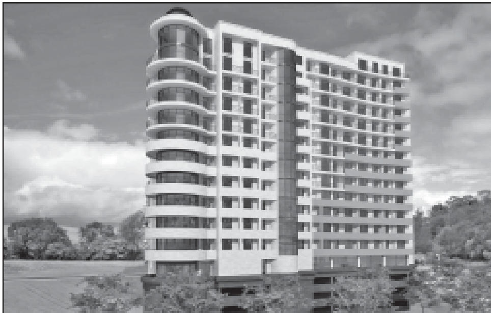
მის: კანდელაკის ქ.№1. ტელ: 38-14-12. 899 62-32-32. 877 76-62-62