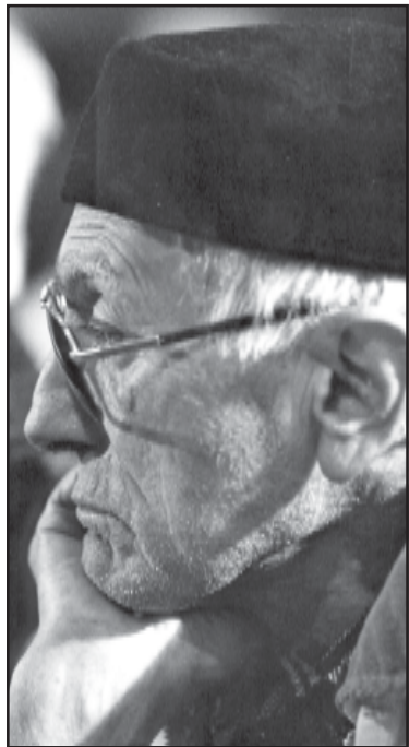
- ავას ხშირად მიკითხვნიან, ვიბროლებო მკვლელობის საპროგრამოებში...

მისი წარღვანა არაა საჭირო არც საპარტოველოში, არც რუსეთში. მისი სახელთან ნახიარობი ვიბროლები - ზადმატი და ყალბია!