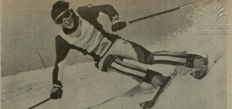
მადონა ზამთრის | სპაეზიონო სპორტული თეაქვენი

ALCO OPTAL BAKHETBA DE SHIMKHESSKIYE KULYURNIYI SPOORTI ENI SORETI MINISTERTSI TOP I REKREACIYONNIYI OTBETI SPOORTSICHESKIY SABAD, KONTAKTNOY, 1985 Y. 21 № 54 (8665) № 3336 2 533. გაზეთი 1984 წლის 13 აპრილიდან