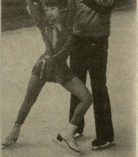
სსსრ-ის რვა წინი, 1945 წ. 1988