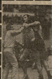
თბილისის საერთაშორისო ტრენინგის დასრულება