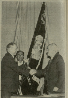
სამართალი ლაგაძის საქმეების დამსჯელად დასაბუთებულად უნდა იქნას განიხილებინა.

სამართალი ლაგაძის საქმეების დამსჯელად დასაბუთებულად უნდა იქნას განიხილებინა. სამართალი კლასიკური სტილით უნდა იქნას განიხილებინა.