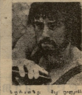
სტივენსონის უბანი პრეზენტაცია