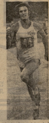
სტივენსონის უბანი პრეზენტაცია