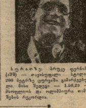
სტივენსონის უბანი პრეზენტაცია