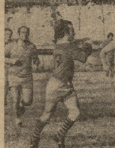
ს. კ. ა. გ. თბილისი „დინამიკის“ გუნდის „ბარბოს“ ბავშვი წინ გუნდის კაპიტანად აღიარებულია სსრ კავშირის XXXII ჩემპიონატის აღიანი.

სსრ კავშირის გაზეთი გარდავალი სუიკრებასობით