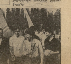
ს. კ. ა. გ. თბილისი „დინამიკის“ გუნდის „ბარბოს“ ბავშვი წინ გუნდის კაპიტანად აღიარებულია სსრ კავშირის XXXII ჩემპიონატის აღიანი.

სპორტული მოსწავლენის დასრულების შემდეგ, სპორტული მოსწავლენი დასრულდნენ სპორტული ღონისძიების განხორციელებაში.